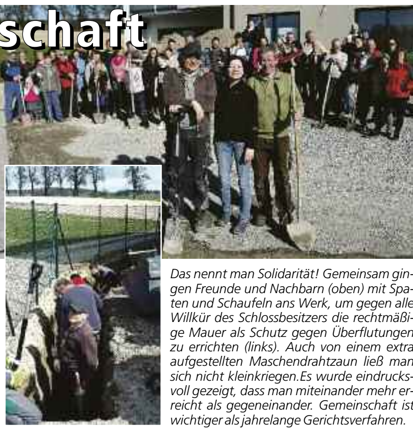
Das nennt man Solidarität! Gemeinsam gingen Freunde und Nachbarn (oben) mit Spaten und Schaufeln ans Werk, um gegen alle Willkür des Schlossbesitzers die rechtmäßige Mauer als Schutz gegen Überflutungen zu errichten (links). Auch von einem extra aufgestellten Maschendrahtzaun ließ man sich nicht kleinkriegen. Es wurde eindrucksvoll gezeigt, dass man miteinander mehr erreicht als gegeneinander. Gemeinschaft ist wichtiger als jahrelange Gerichtsverfahren.

Kurz vor Baubeginn kam die nächste Überraschung: Auf der Schotterstraße wurde ein 25 Meter langer Maschendrahtzaun entlang der geplanten Mauer errichtet. Davon ließ man sich aber nicht einschüchtern. Kurzsentschlossen halfen viele Freunde und Nachbarn zusammen, und erledigten gemeinsam die Grabungsarbeiten. Jetzt steht die Mauer!