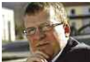
Von Rechtsanwalt Dr. Bernhard Birek, Schlüßlberg