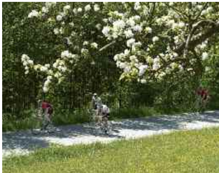
Die Kirschblüten-Radklassik führt durch reizvolle Landschaft.

Holz Schneitler GmbH | im Gewerbepark Schneitler direkt an der B137 | Industriestraße 27 | 4710 Grieskirchen Tel. 07248 / 625 32 | e-mail: office@schneitler.at | Internet: www.schneitler.at